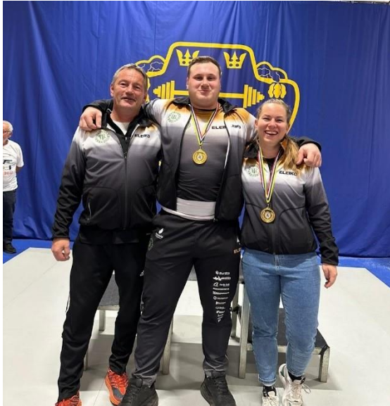
To deltakarar frå Tambarskjelvar IL og to gull:

Nordisk Meisterskap for senior, Landskrona, Sverige 27-28.oktober